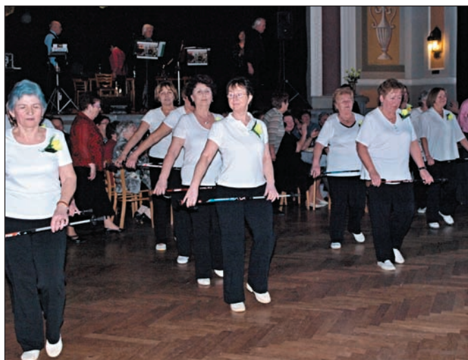
Snímky ze Seniorského plesu