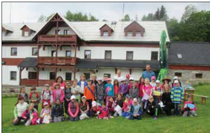
Foto k článku Škola v přírodě na str. 2