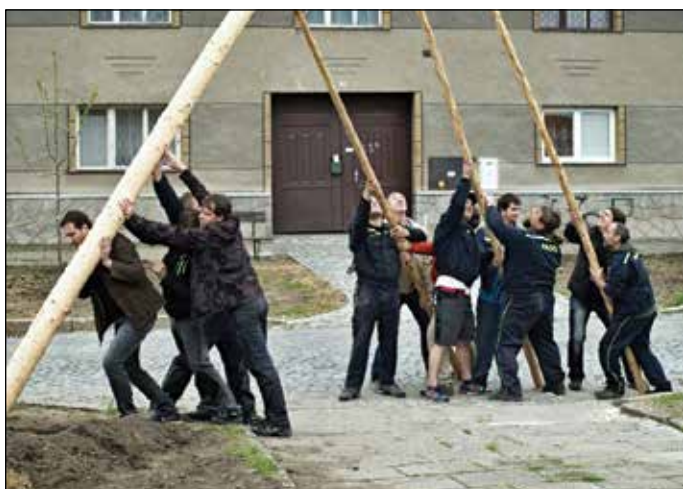
Foto k článku Máj na návsi na str. 7