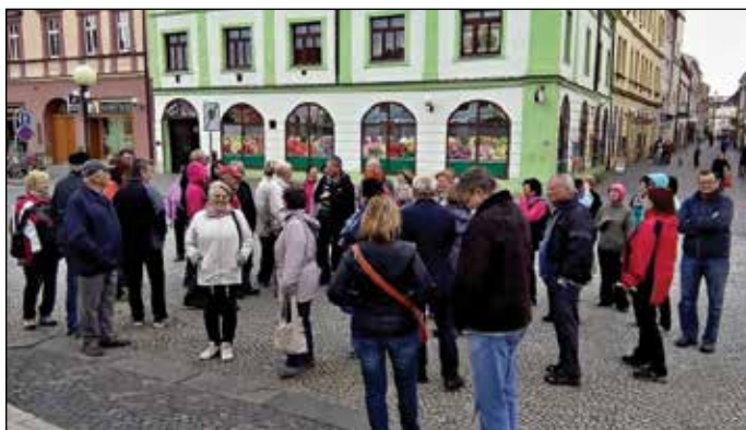
Foto k článku Zájezd z Příkaz do Uherského Hradiště na str. 7