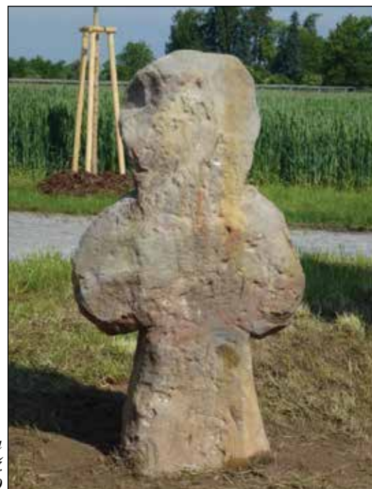
Foto k článku Smířící kříž na str. 9