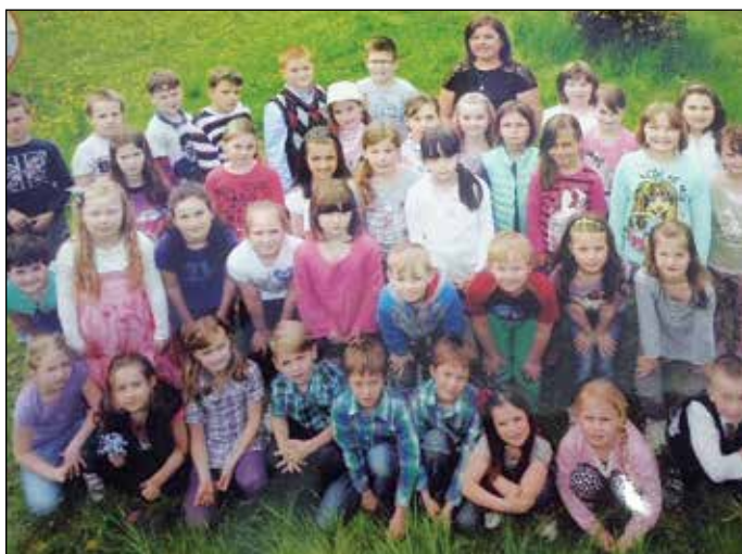
Foto k článku Závěr školního roku v družině na str. 2