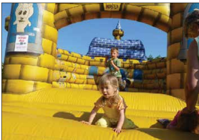
Foto k článku Zahradní slavnost na str. 2