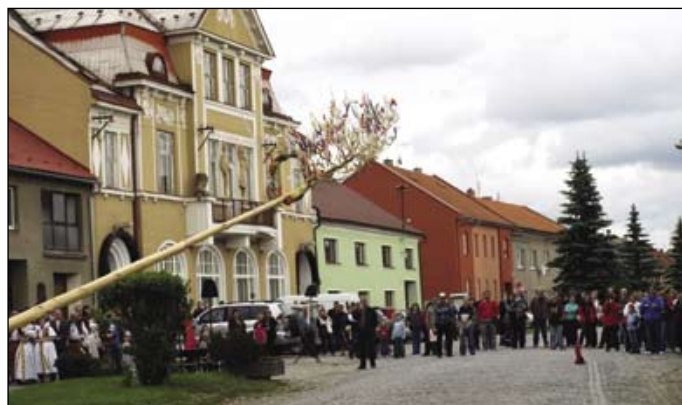
Zato při kácení Máje - 1.června - hrozily těžké mraky