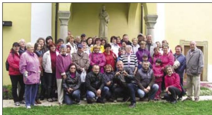
Před poutní kaplí Sv. Antonínka