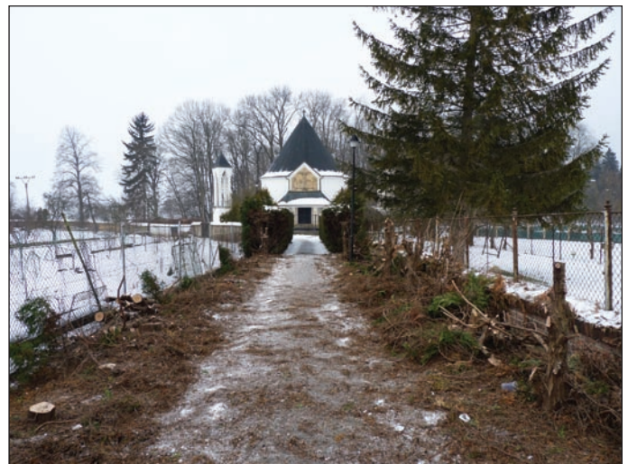
Likvidace přerostlých tůjí v Hanákové uličce