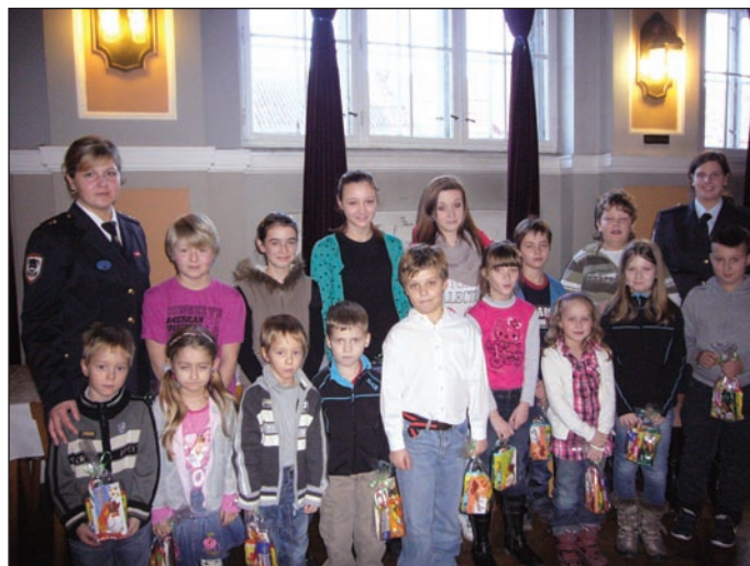
Příkazští mladí hasiči